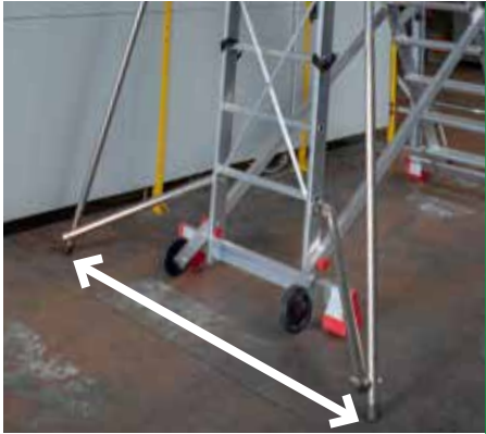
Zwolnienie stabilizatora. Open stabilisers.