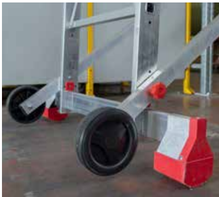
Masywny stabilizator. New stabilizer base.