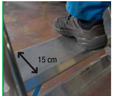
Wygodny stopień o szerokości 15 cm. 15 cm steps ensuring safe climbing.