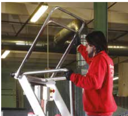
Łatwy dostęp i zabezpieczenie na 360°. Easy access and a protection 360°.