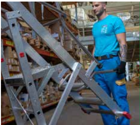
Łatwe przemieszczanie. Easy to move.