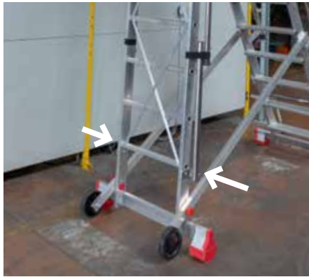
Bokada stabilizatora. Closed stabilisers.

Maksymalne bezpieczeństwo, zapobieganie przechyleniu przy pomocy bocznych stabilizatorów, które po zamknięciu ułatwiają pracę na platformie. Maximum anti-tilting safety with side outriggers which, once closed, facilitate movement of the ladder.